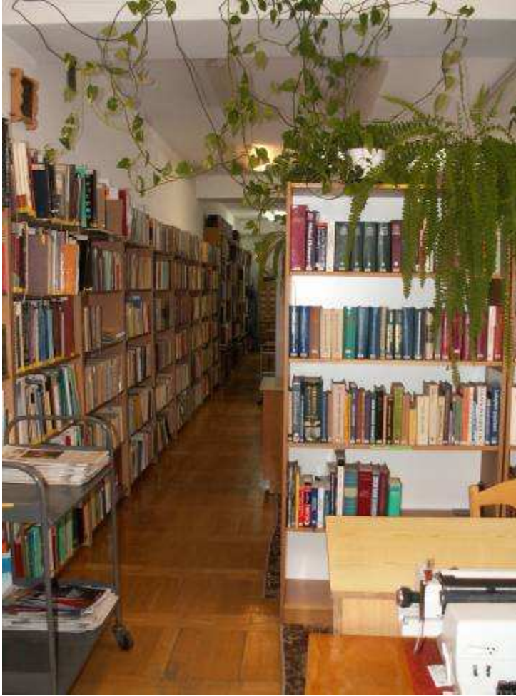
Magazyn druków zwartych

W maju 1991 roku biblioteka wznowiła swoją działalność. Wkrótce, w tymże roku, otwarty został w Szpitalu pierwszy oddział. Sukcesywnie oddawano do użytku następne oddziały szpitalne, wyposażane w nową aparaturę i sprzęt.