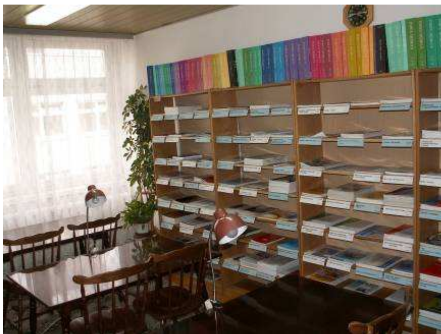
Czytelnia czasopism w Wojewódzkim Szpitalu Specjalistycznym

Po niewielkich zmianach i adaptacji rozwiązanie problemu okazało się bardzo udane.