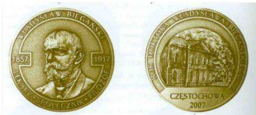
Medal okolicznościowy wydany z okazji Roku Doktora Wł. Biegańskiego

Byliśmy także uhonorowywani odznaczeniami, w tym Medalem Okolicznościowym, wydanym w roku 2007 z okazji Roku Doktora Wł. Biegańskiego