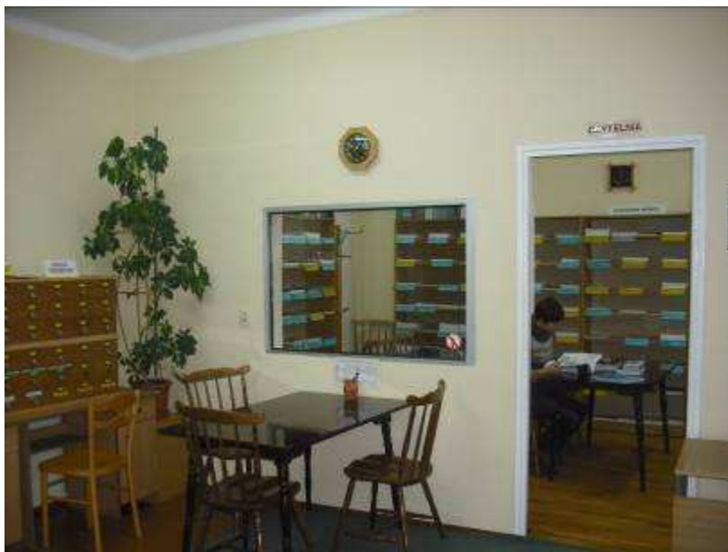
Wypożyczalnia i czytelnia w nowej siedzibie

Obecnie posiadamy księgozbiór liczący 7 462 wol. druków zwartych oraz 1 771 wol. roczników czasopism.